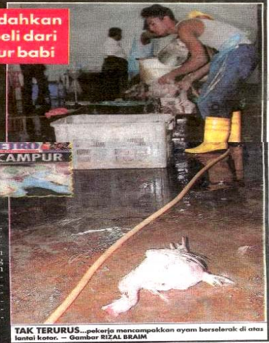
TAK TERURUS... pekerja mencampurkan ayam berselak di atas lantai kotor.